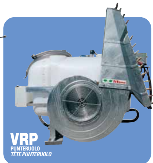
VRP PUNTERUOLO TÊTE PUNTERUOLO