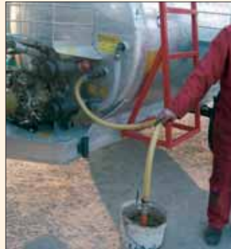
Sonda Aspiratrice F2. Sonde-Aspirateur F2 Dissolveur de pesticides en poudre.