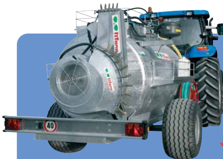
TIFON-CAR TESTA MISTA TÊTE COMBINÉE