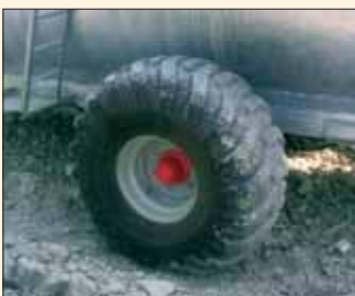
Ruote extra-large per ogni terreno. Roues extralarges tout-terrain.