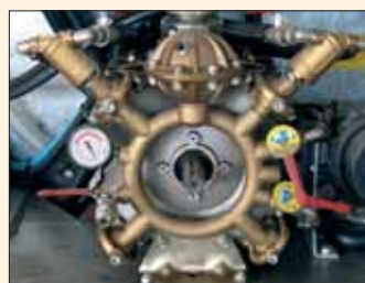
Superpompe da 140 a 220 l/min. in bronzo con filtri autopulenti. Pressione regolabile fino a 50 bar. Superpompes de 140 à 220 l/min, 50 bar, en bronze, avec filtres autonettoyants.