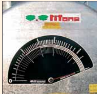
Grande livello meccanico. Indicateur niveau en cuve.