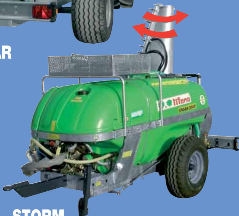
STORM PUNTERUOLO PENNELLANTE AUTOMATICO TÊTE PUNTERUOLO VA-ET-VIENT AUTOMATIQUE