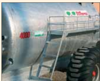
Scaletta per accesso al porta-accessori. Échelle accès au porte-accessoires.