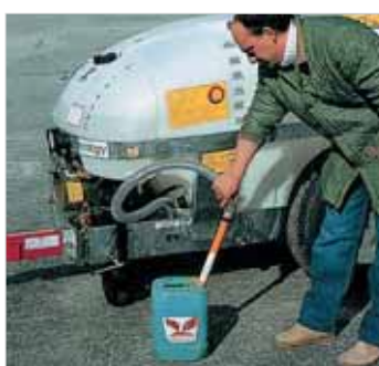
Instant suction-mixing of formulates. Aspirador+mezclador de fitofarmacos.