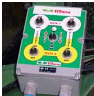
Remote controls from tractor. Mandos electricos al tractor.