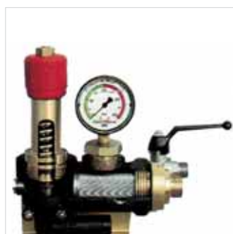
Fully automatic self-clean filter. Filtro autolimpiante automatico.