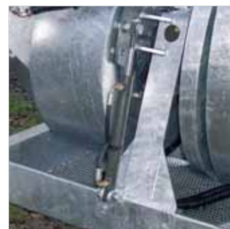
Remote adjustable Spray-Head. Angulo de tratamiento reglable hidr.