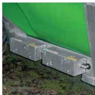
Tifone-Bosch valves. Electrovalvulas Tifone-Bosch.